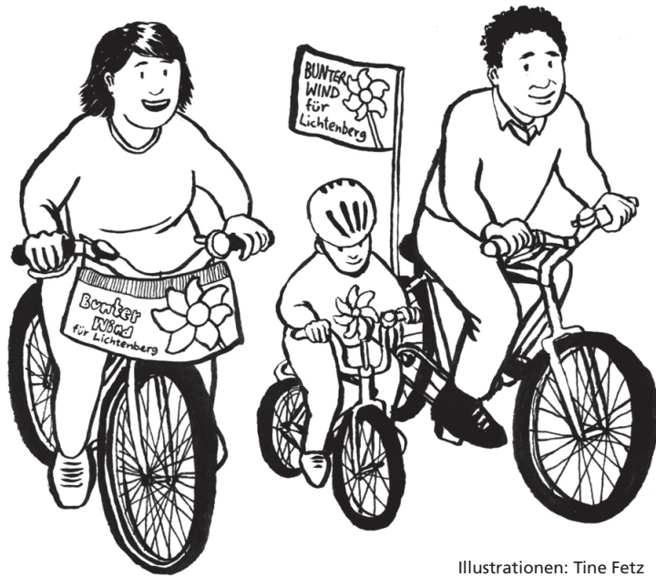
Illustrationen: Tine Fetz